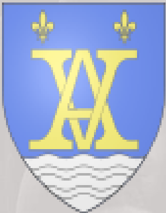
BLASON DE LA VILLE D'AUBAGNE

AUBAGNE (AUBANHA en occitan provençal) est une commune française, située dans le département des Bouches du Rhône, et la région PACA (Provence-Alpes-Côte d'Azur).